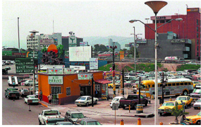
Tijuana, en la frontera entre México y Estados Unidos. ALBERTO FERRERAS

El resultado final es una parodia involuntaria del género, llena de personajes cañís, planos e insustanciales que, gracias a la ausencia de referentes geográficos, rozan las cumbres nevadas del tedio más disparatado.